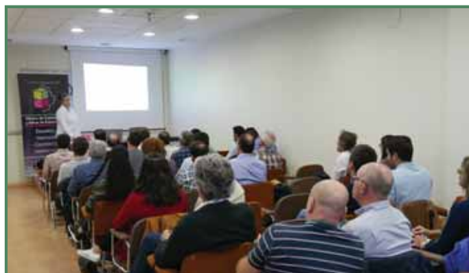
Jornadas sobre Informe y Evaluación del Edificio en nuestra sede

de darlo a conocer, tanto en nuestra región como fuera de ella. Este compromiso nos ha llevado a establecer acuerdos de colaboración para futuros proyectos con otros clústeres, y entidades del conocimiento, tanto a nivel nacional como internacional.