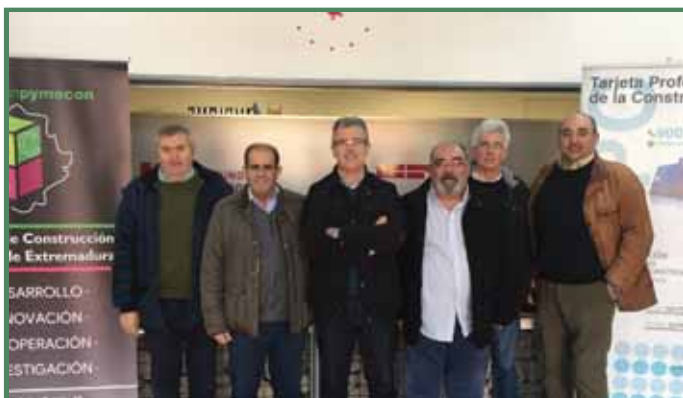
Presentación de nuestro Clúster en la Fundación Laboral de la Construcción junto a representantes sindicales