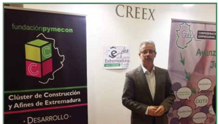
El Clúster de la Construcción de Extremadura presente en FICON