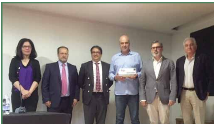
Acto de entrega del III premio Clúster de la Construcción a la mejor empresa rehabilitadora

Para todo ello, el Clúster de la Construcción de Extremadura ha llevado una serie de acciones con el compromiso